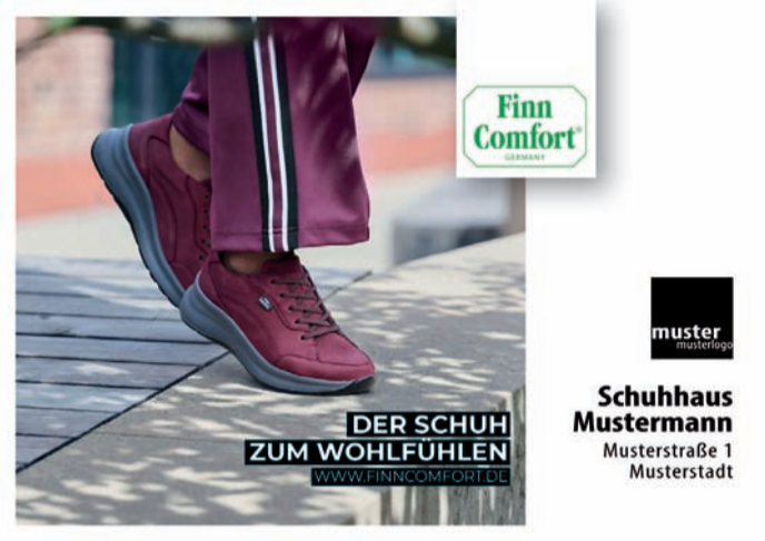
FinnComfort Großflächenmotiv Herbst/Winter

FinnComfort unterstützt den stationären Handel auch in der Saison Herbst/Winter 2026 mit aufmerksamkeitsstarken Großflächenplakaten. So erreichen Sie Ihre Kundinnen und Kunden genau dort, wo sie unterwegs sind – sichtbar, stilvoll und wirkungsvoll.