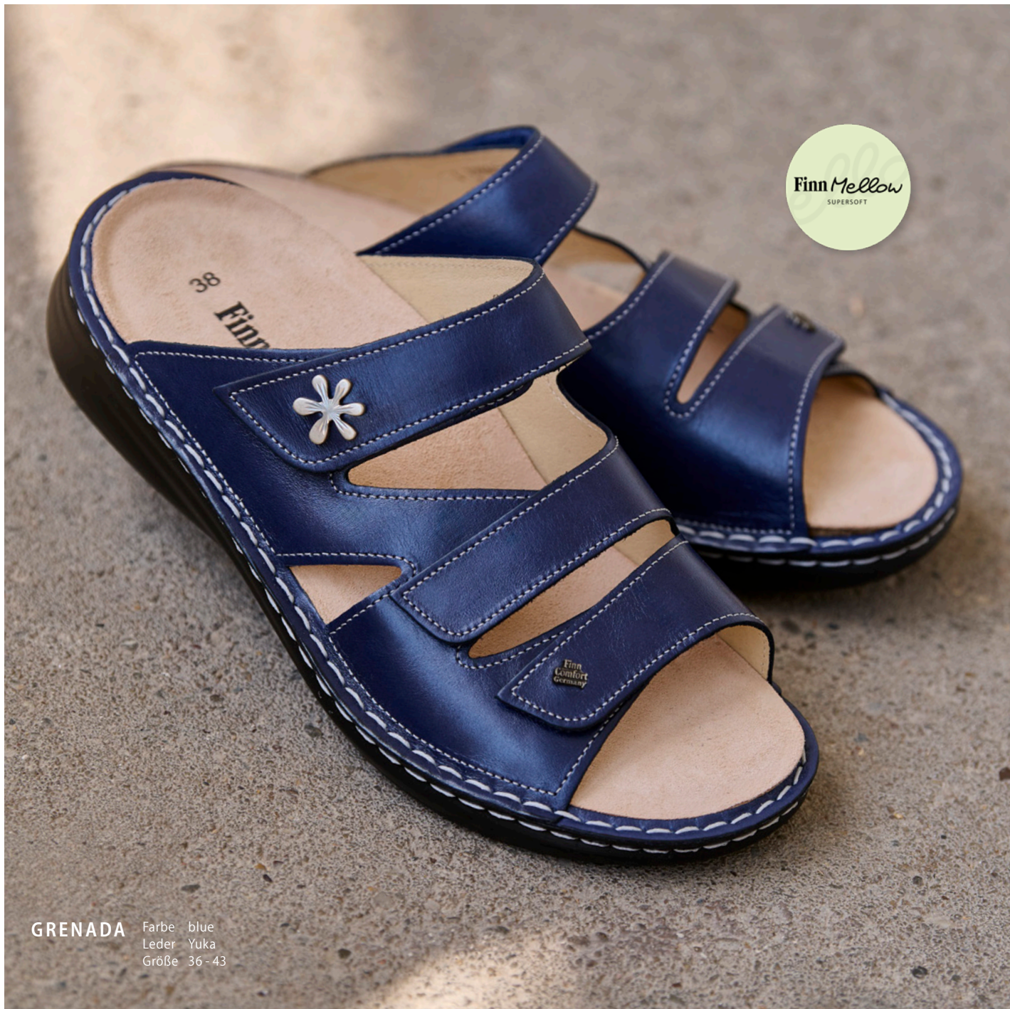
GRENADA Farbe blue Leder Yuka Größe 36-43