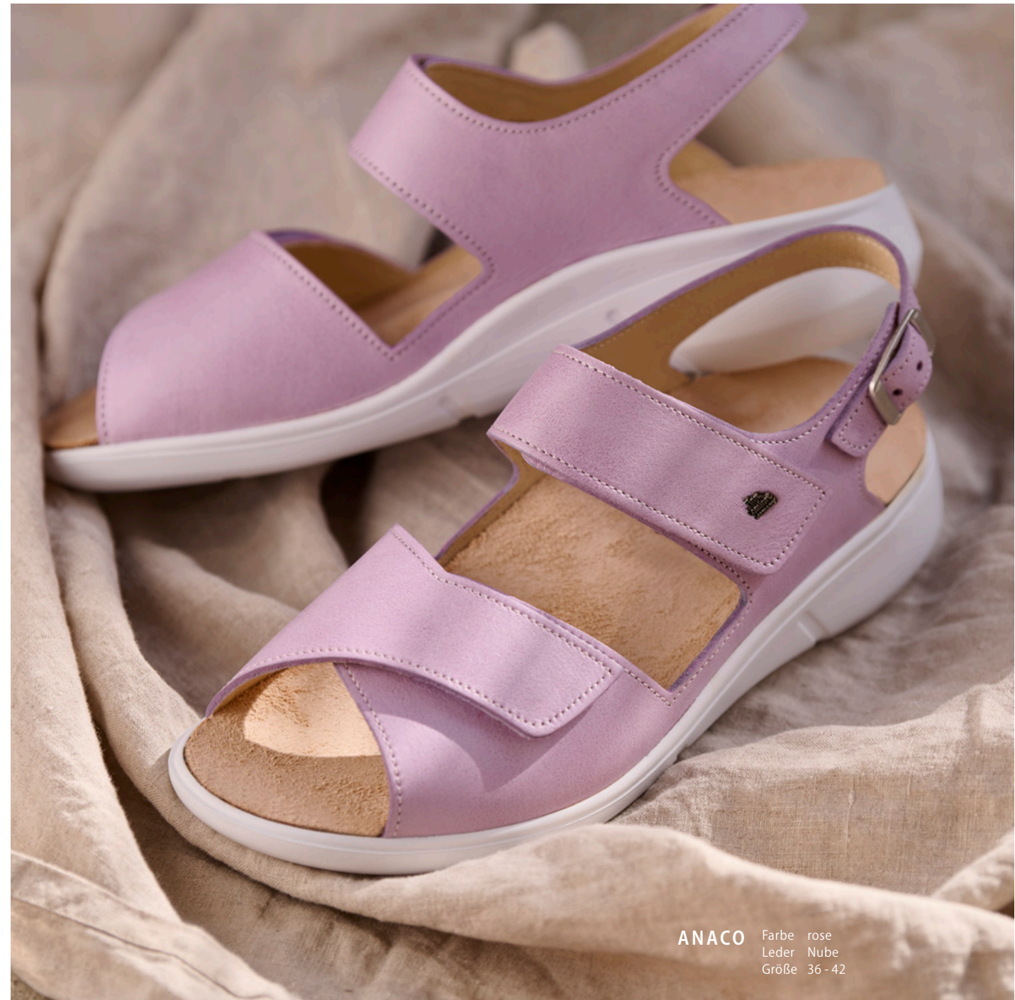
ANACO Farbe rose Leder Nube Größe 36-42