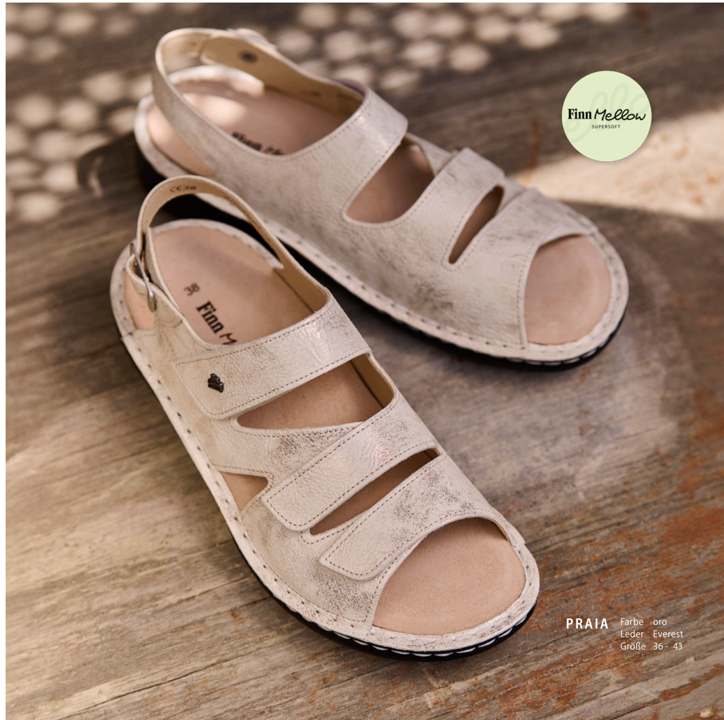
PRAIA Farbe oro Leder Everest Größe 36 - 43