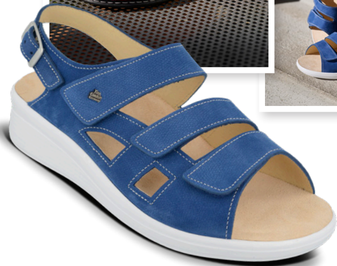
PINTO Farbe atoll Leder Orida Größe 36-42