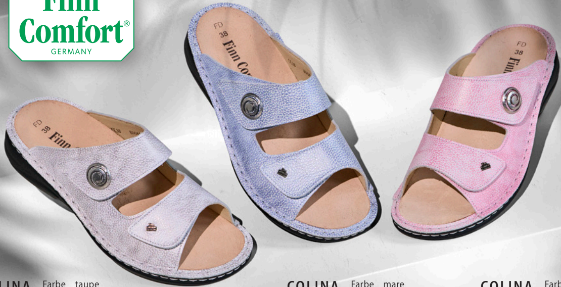
COLINA Farbe taupe Leder Natural Größe 36 - 43

WALDI SCHUHFABRIK GMBH • 97433 HASSFURT • WWW.FINNCOMFORT.DE