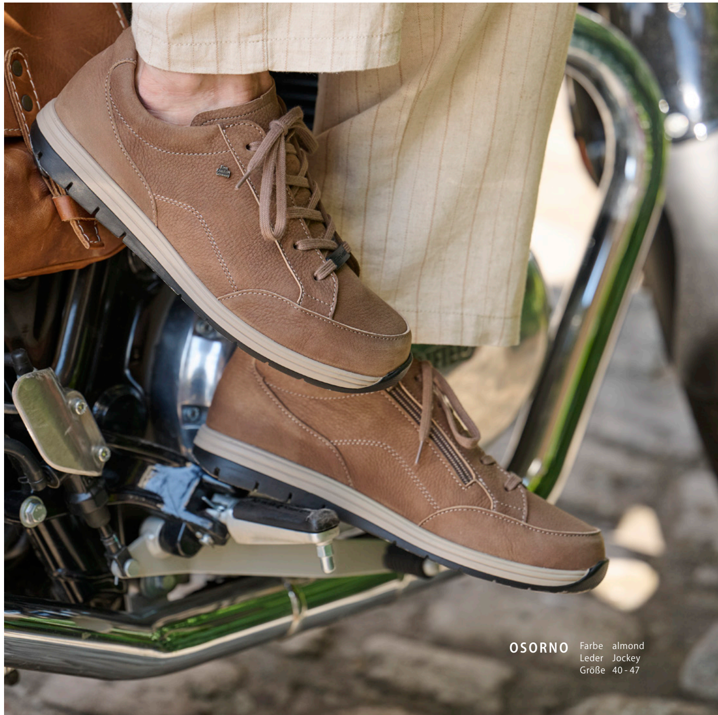
OSORNO Farbe almond Leder Jockey Größe 40 - 47