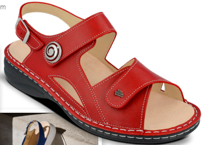
DENIA Farbe pomodoro Leder Nube Größe 36-43