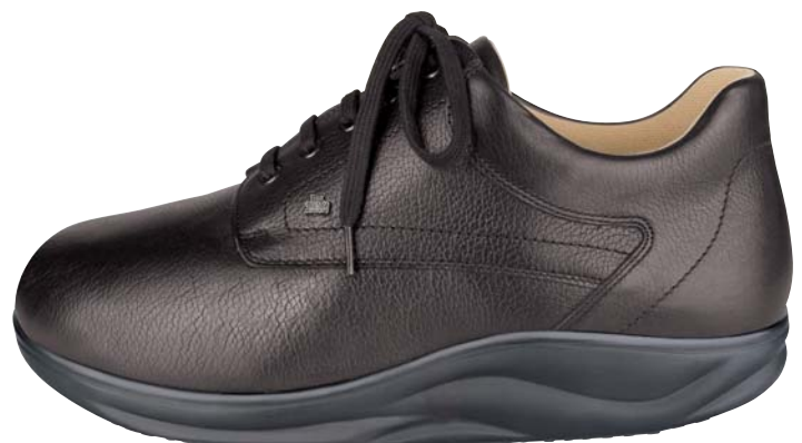
97701 Leder: SponaRind Farbe: kaffee Größe: 6 - 12 97911 mit versteifter Brandsohle

Da der FinnOrtho mit versteifter Brandsohle alle Voraussetzungen eines Diabetiker-Therapieschuhs erfüllt, ist er gegen Kostenvoranschlag bei diversen Krankenkassen abrechnungsfähig.