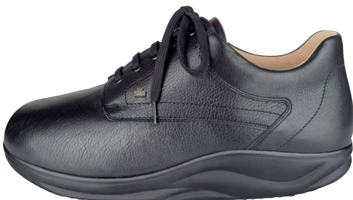
97701 Leder: SponaRind Farbe: schwarz Größe: 3 - 12 97911 mit versteifter Brandsohle