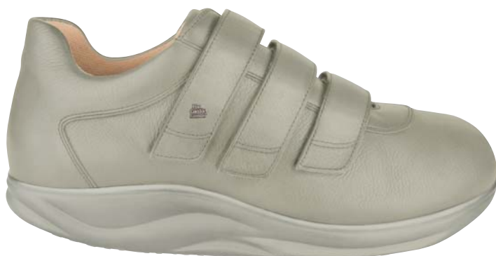
97700 Leder: SponaRind Farbe: creme Größe: 3 - 9 97910 mit versteifter Brandsohle