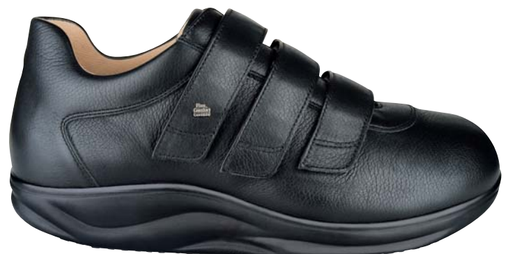
97700 Leder: SponaRind Farbe: schwarz Größe: 3 - 12 97910 mit versteifter Brandsohle